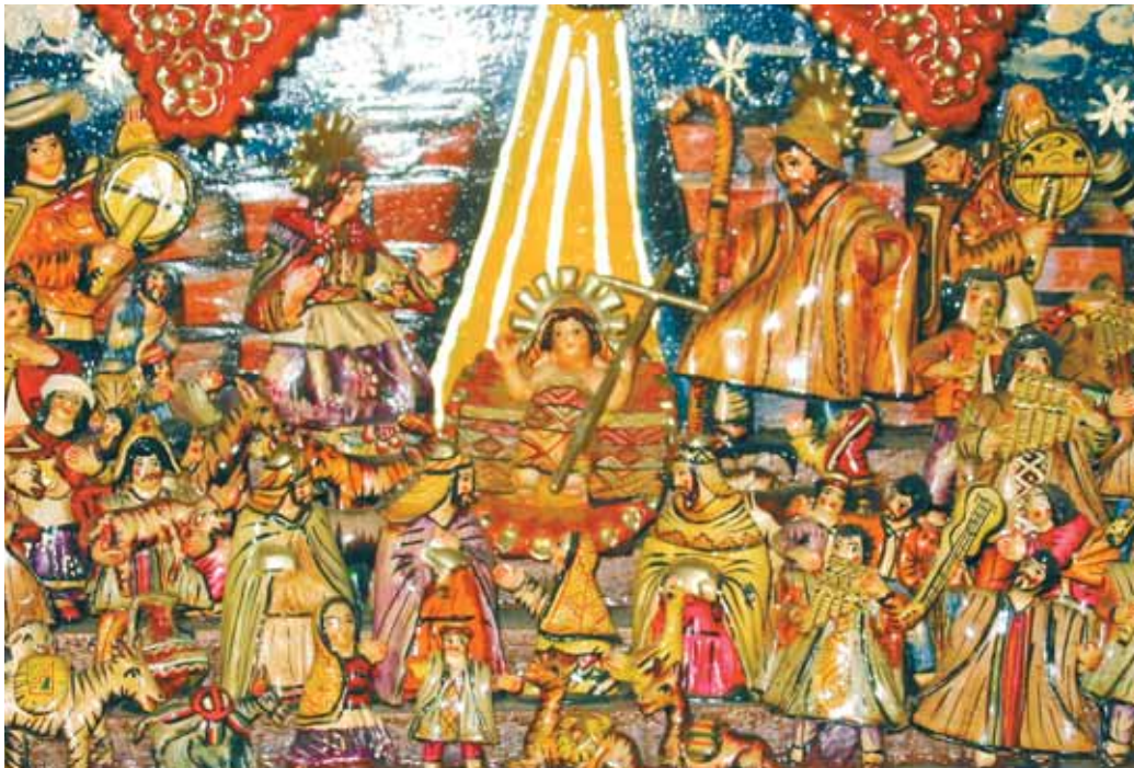
Santons in einem Retabel (Ausschnitt) Gemodelte Figuren aus Gips, Kartoffelstärke und Leim Ayacucho / Peru 1993

Es gab schon einmal 1994 eine ähnliche Entscheidung in Südfrankreich. Eigentlich ist die Provence ja für die „Santons“, die „kleinen Heiligen“ bekannt. Die luftgetrockneten und in frohen Farben kalt bemalten Modellfiguren, die seit 1803 auf dem Markt in Marseille als Miniaturfiguren („Flöhe“), Kleinfiguren („Zikaden“) und Normalfiguren in 7 bis 16 cm Größe in ähnlich traditionellen Figurentypen (Fischer, altes Ehepaar, Blinder mit Enkel...) wie im Salzkammergut angeboten wurden, haben nämlich Pendants gleichen Namens, die allerdings einer anderen Tradition folgen. Denn dort, wo die Provence die kulturelle und geographische Brücke zwischen den Krippenländern Italien und Spanien bildet, führen Künstler die Krippentradition mit nach italienischem Vorbild gekleideten Figuren fort. So modelliert der Bildhauer Julien Devouassoux in Puyvert le Village nicht weit von Aix-en-Provence die sichtbaren Körperteile seiner „Santons“ aus Terracotta