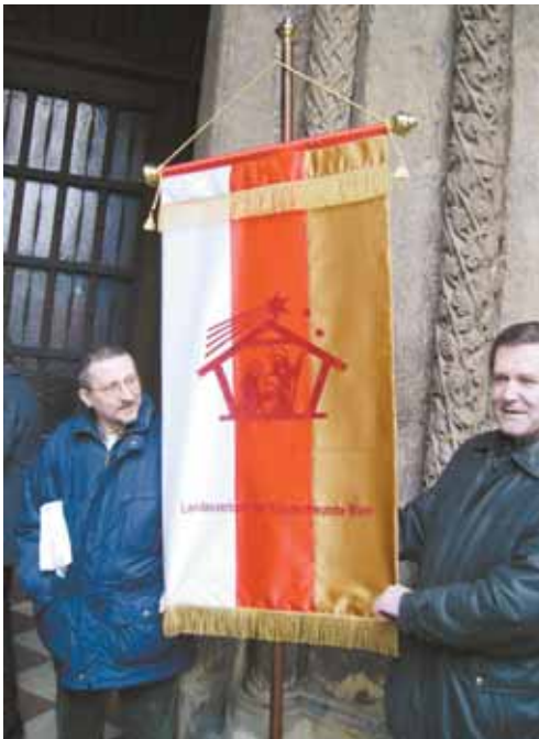
Fahne des Landesverbandes Wien.

Ihre Bitte um Bewahrung der alten Krippen und bei der Sorgfalt und fachgerechten Behandlung bei der Restaurierung alter