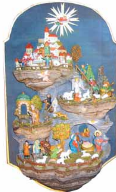
Krippe aus Wien.

Dann ging es mehr als 130 Stufen ein Stück den Nordturm hinauf in den Dachboden des ehrwürdigen Gotteshauses. Die ausgeklügelten Verstrebenungen und die Höhe und Weite des Dachbodenraumes ließen erst recht die Mächtigkeit des Domes erahnen. Ein Rundgang an den Dachrinnen direkt im Blickfeld von Bummering und dem hohen Turm rundete die eindrucksvolle Führung ab.