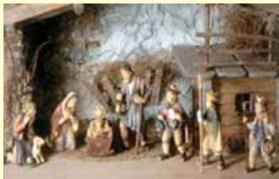
Riesige Auswahl an Holzkrippenfiguren Neue heimische Krippe