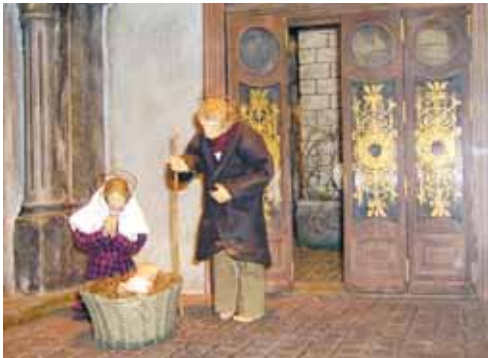
Krippe aus Wien.