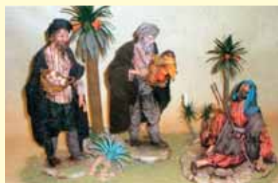
Größte Auswahl von Terracotta-Figuren aus Italien und Spanien im Bild (die Terranova-Krippe)

A-6240 Rattenberg – Südtirolerstr. 33 Tel. 0 53 37/67 097 Fax 0 53 37/67 090 e-mail: egger@rattenberg.at