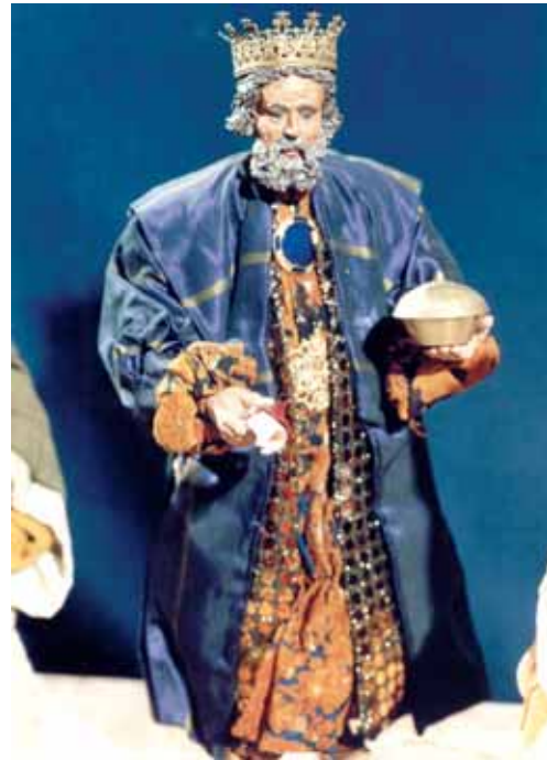
Künstlerkrippe mit Santons

Was aber unterscheidet oder verbindet nun Krippen der anderen Kontinente mit denjenigen unseres Kulturkreises? Wenden wir uns vorerst dem Verbindenden zu: beinahe in allen Darstellungen der Geburt Christi begegnen uns dieselben Hauptfiguren wie in den heimischen Krippen: als Mittelpunkt das Jesuskind, dazu Maria und Josef, der Ochs und der Esel, die heiligen drei Könige, ein Engel, vielleicht noch Hirten, Gabenbringer