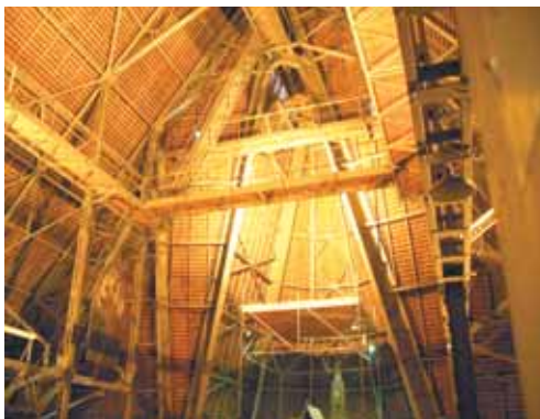
Dachstuhl im Stephansdom.

Sehr viele Teilnehmer hatten sich entschlossen, an der Führung durch den Stephansdom teilzunehmen, die sozusagen vom Keller bis hinauf in den Dachboden führte und gleichermaßen einen Streifzug durch die Geschichte des Domes beinhaltete und bei den bedeutendsten Kulturdenkmälern des Domes Halt machte. Wie etwa bei der aus drei Steinblöcken bestehenden Kanzel mit dem symbolträchtigen Handlauf, dem einzigen gotischen Flügelaltar in der Kirche, dem so genannten Wiener Neustädter Altar, dem Hochgrab Friedrichs III oder etwa der viel verehrten Dienstbotenmadonna.