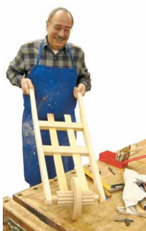
In einem Kurs werden neue Ratschen gebaut.

„Wir ratsch`n, wir ratsch`n des letzte Mal z`samm, denn die Glock`n, die kemman bald wieda von Rom.“